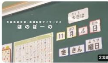
児童発達支援・放課後 デイサービス ほのぼーの

裏表紙のQRコードから 商工会の公式チャンネルに アクセスできます。 ぜひご覧ください。 登録もお願いします。