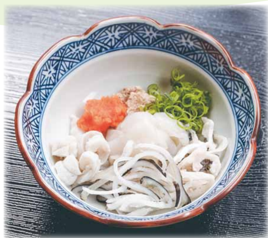
(写真はイメージです)